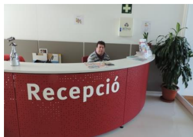
Control de accesos, recepción y conserjería