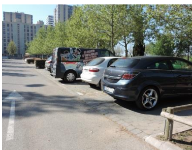
Gestión de aparcamientos