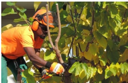
Servicios de jardinería y trabajos en el medio natural