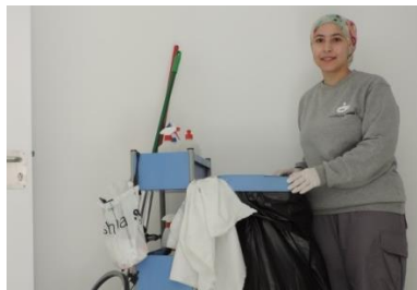
Servicios de limpieza y mantenimiento de espacios