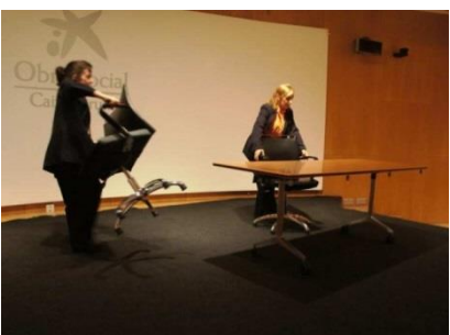
Soporte en eventos