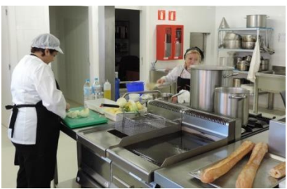
Servicios turísticos y de restauración